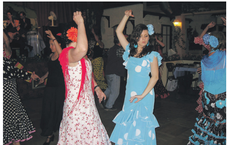
Der undervises i dans med kastagnetter, hatte, vifter og sjal.